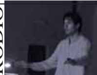
LA MUSICA A COLORI/3

Per ognuno di noi la ricerca e l'esigenza del ritmo è costante. Ritmo e "respiro interno" rappresentano connotati interiori immutabili, paragonabili alle nostre impronte digitali, non variano mai