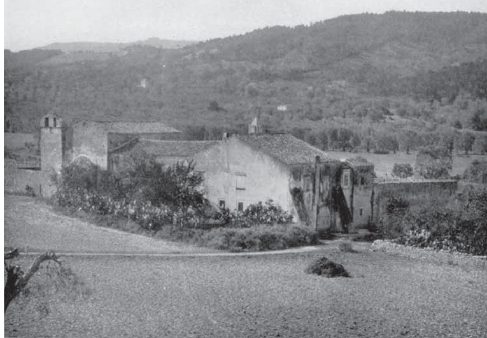
Peschici. L'Abbazia di Càlena nei primi anni del Novecento.

[Peschici con altri occhi. Cinque secoli di testimonianze di passanti (non) occasionali, a cura di Michel'Antonio Piemontese, Tipografia Piemontese, Peschici 2011, €6,00]