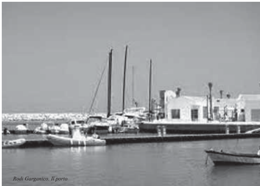
Rodi Garganico. Il porto

Un percorso quindi di ascolto che ha portato a disegnare una rete scolastica secondo questi criteri: accorpamento di scuole fortemente sottodimensionate rispetto ai parametri previsti, costituzione di istituti comprensivi soprattutto in città medio-grandi; salvaguardia, in via eccezionale dell'autonomia di scuole sia pure sottodimensionate, ma che costituiscono presidi di aggregazione culturale e sociale in realtà territoriali socialmente svantaggiate; mantenimento di scuole sovradimensionate rispetto ai parametri previsti in presenza di impegno a una autoriduzione delle iscrizioni nelle prime classi.