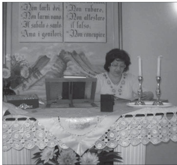
Sinagoga della comunità ebraica a Sannicandro Garganico. Agli inizi del 1948, circa 70 sannicandresi, spinti dal grande desiderio di andare nella Terra Promessa che Dio aveva riservato al suo popolo, emigrarono in Israele. La comunità attualmente conta circa 50 membri, che con grande fede continuano ad osservare lo Shabbath e le festività, educando i loro figli nell'ebraismo.

Lo Yom haShoah si impose subito in Israele come Giorno della Memoria; dopo il 1945, la Shoah consumatasi in Europa giungeva nella Palestina Mandataria attraverso le ferite del corpo e dell'anima dei sopravvissuti giunti in clandestinità. L'esercito britannico, che