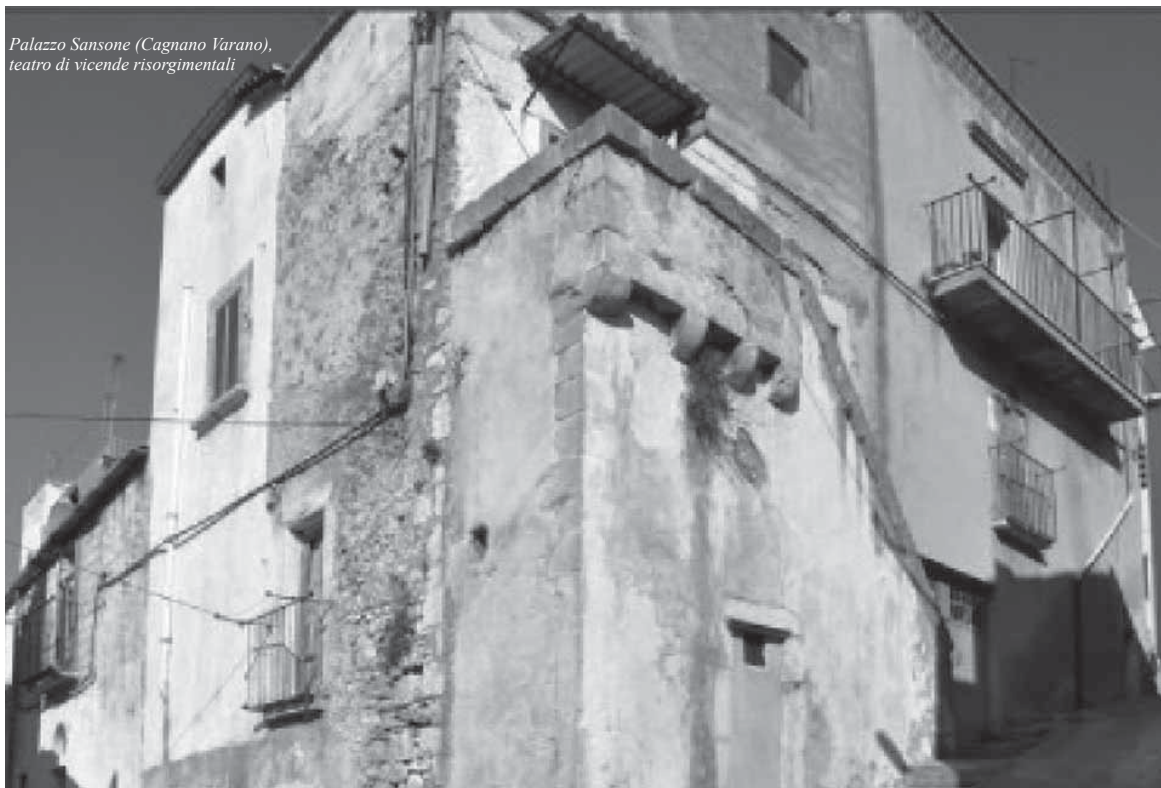
Palazzo Sansone (Cagnano Varano), teatro di vicende risorgimentali

allora, era stato loro negato? Notevole era il patrimonio terriero che cinquant'anni prima, nel 1806, quando fu abolita la feudalità, era stato assegnato ai Comuni, e che si stava erodendo a causa delle continue appropriazioni illegali proprio da parte di quei notabili che li segnalavano alla polizia borbonica come settari.