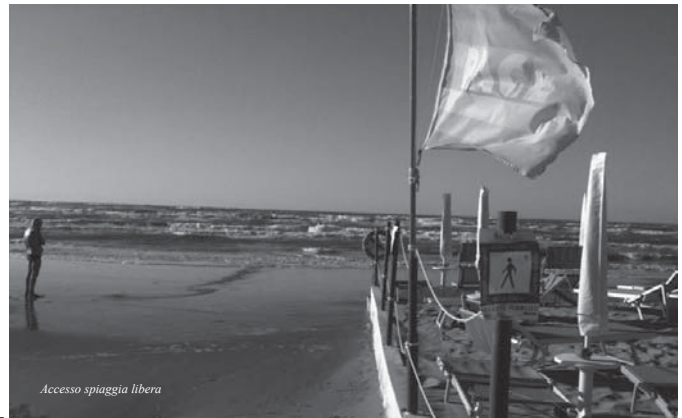
Accesso spiaggia libera

petroliere), e, soprattutto, non risponde al fermento effervescente e intelligente di cui la comunità sociale e non istituzionale del nostro parco sta dando prova. La comunità istituzionale deve invece costituirsi e deve rivendicare il ruolo proprio in un Consiglio direttivo legittimamente insediato e operativo, che affianchi un presidente di Parco legittimato e frutto dell'intersa e della condivisione tra regione e ministero, come logica vuole e come legge impone. Gianfranco Eugenio Pazienza