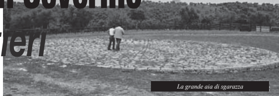
La grande aia di sgarazza