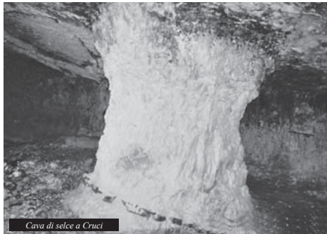
Cava di selce a Cruci

Voglio ribadire, con forza, che un intervento veloce può fermare l'incendio; dopo, anche con l'acqua, è più difficile. E' auspicabile che le Istituzioni si attivino per far crescere nei giovani la percezione di quanto sia importante per loro e per il bene comune il volontariato. FINE