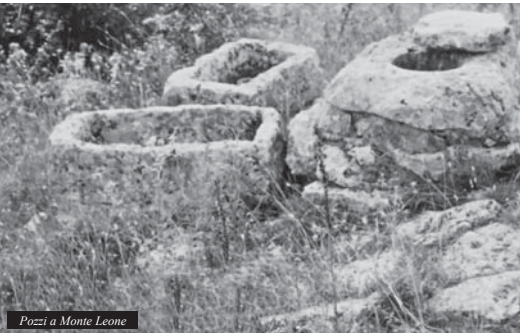
Pozzi a Monte Leone

le "Grotta Piazzenza" ricca di preistoriche pitture e poco distante da questa esiste il riparo "Riposo" con le sue incisioni. Non c'è più traccia del lago di Fara, è sparito. Purtroppo, per volontà dell'uomo la stessa sorte è toccata al lago di Sant'Egidio; sono per fortuna ancora godibili i laghi di Lesina e di Varano ben noti per i loro prodotti ittici, per la loro storia religiosa (San Clemente, San Placido, Santissima Annunziata), umana (insediamenti rupestri a Bagno), mili-