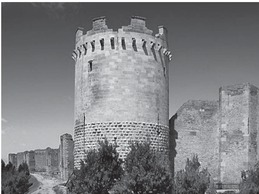
Vista aerea e torione dell'imponente Castello costruito da "Stupor Mundi" Federico II nel 1233 sulle fondamenta di una cattedrale romanica. Le mura furono aggiunte successivamente (tra il 1269 e il 1283) da Carlo I d'Angiò per trasformare la struttura da palazzo imperiale a castello fortificato.

I Saraceni installati nei grandi centri pugliesi godettero di privilegi che portarono molti di loro al livello di alte cariche dello Stato. Quelli, al contrario, dislocati nelle campagne, nella condizione di servi, riuscirono ad avere il possesso di terreni con il vincolo di pagare in derrate annuali e con la