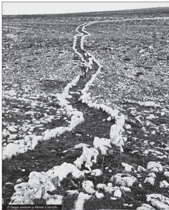
Il lungo sentiero a Monte Calvello

E' giusto e meritorio pubblicizzare l'importantissima Grotta Pauglicci ma, ai fini promozionali, sarebbe opportuno ricordare che a fianco c'è Grotta dei Pilastri e nella vicina valle Ividori è visitabi-