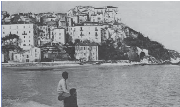
A proposito de L'idioma di Rodi, del dialetto e delle sue regole